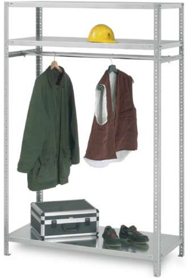
Kleiderstangenregale, Schraubsystem WR