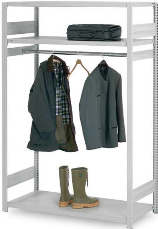
Kleiderstangenregale, Stecksystem ORION PLUS