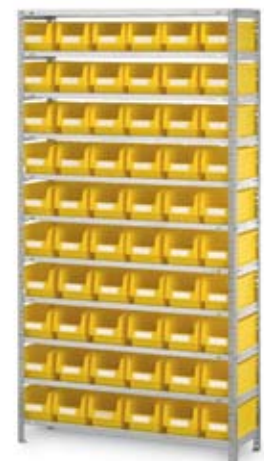
Regale mit Sichtlagerkästen auf Seite 104