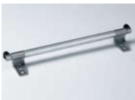
Stahlrohr (Ø 30 mm) - Anpassung an Regalbreite erfolgt bauseits. Abbildung mit Endanschlägen.